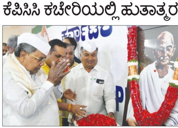
ಕೆಪಿಸಿಸಿ ಕಚೇರಿಯಲ್ಲಿ ಗುರುವಾರ ನಡೆದ ಹುತಾತ್ಮರ ದಿನದ ಅಂಗವಾಗಿ ಮುಖ್ಯಮಂತ್ರಿ ಸಿದ್ದರಾಮಯ್ಯ, ಉಪ ಮುಖ್ಯಮಂತ್ರಿ ಡಿ.ಕೆ. ಶಿವಕುಮಾರ್ ಮಹಾತ್ಮ ಗಾಂಧೀಜಿ ಅವರ ಭಾವಚಿತ್ರಕ್ಕೆ ಪುಷ್ಪ ಸಮಾನ ಸಲ್ಲಿಸಿದರು.

ಕನ್ನಡಪ್ರಭ ವಾರ್ತೆ ಬೆಂಗಳೂರು ಮಹಾತ್ಮ ಗಾಂಧೀಜಿ ಅವರ ಮೌಲ್ಯಗಳನ್ನು ಮಹಾನ್ ನಾಥರಾಗಿಯೇ ಗೋಡೆಯಾಗಲಿ ಅಥವಾ ಇನ್ನೊಂದೆಡೆ ಕೊಲ್ಲಲು ಸಾಧ್ಯವಿಲ್ಲ ಎಂದು ಸಿಎಂ ಸಿದ್ದರಾಮಯ್ಯ ಅಭಿಪ್ರಾಯಪಟ್ಟರು. ಗುರುವಾರ ಕ್ಷೇತ್ರ ರಸ್ತೆಯಲ್ಲಿರುವ ಕೆಪಿಸಿಸಿ ಕಚೇರಿಯಲ್ಲಿ ಅಯೋಜಿಸಲಾಗಿದ್ದ ಹುತಾತ್ಮರ ದಿನಾಚರಣೆಯಲ್ಲಿ ಮಹಾತ್ಮರ ಶ್ರದ್ಧಾಂಜಲಿ ಸಲ್ಲಿಸಿ ಮಾತನಾಡಿ, ಗಾಂಧೀಜಿ ತಾರ್ಕಿಕರು ಇಂದಿಗೂ ಪ್ರಸ್ತುತ. ತನ್ನ ಜೀವನವೇ ಒಂದು ಸಂದೇಶ ಎಂದು ನುಡಿದಿದ್ದ ಗಾಂಧೀಜಿ ಅವರ ಹೋರಾಟದ ಬದುಕು ಪ್ರೇರಣಾದಾಯಕ. 1948 ಜ.30ರಂದು ಗಾಂಧೀಜಿ ಅವರನ್ನು ಗೋಡೆ ಹತ್ತಿ ಮಾಡಿದ ದಿನ. ಗಾಂಧೀಜಿ ಇಹಲೋಕ ತ್ಯಜಿಸಿದ್ದರೂ ಅವರ ಸತ್ಯ, ಅಹಿಂಸೆ ಹೋರಾಟದ ಮೌಲ್ಯಗಳನ್ನು ಕೊನೆಗೊಳಿಸಲು ಯಾರಿಂದಲೂ ಸಾಧ್ಯವಿಲ್ಲ ಎಂದು.