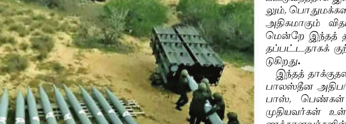
ஹமாஸ் அமைப்பினர் 'எம்90' ஏவுகணைகள் (கோப்புப் படம்).

டெல் அவீவ் / காலா சிட்டி, ஆக. 13: இஸ்ரேல் மீது ஹமாஸ் அமைப்பினர் இரு ஏவுகணைகளை வீசி தாக்குதல் நடத்தினர். இருந்தாலும், இந்தத் தாக்குதலில் யாரும் காயமடையவில்லை என்று இஸ்ரேல் தெரிவித்துள்ளது.