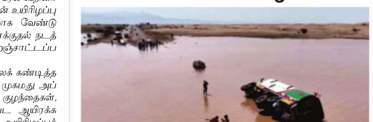
எடன், ஆக. 13: யேமனில் கனமழை காரணமாக ஏற்பட்ட வெள்ளப் பெருக்கில் 57 பேர் உயிரிழந்தனர்.

இது குறித்து ஐ.நா. வெளியிட்ட அறிக்கையில் தெரிவிக்கப்பட்டுள்ளதாவது: யேமனில் தொடர்ந்து பெய்துவரும் கனமழை காரணமாக பல்வேறு பகுதிகளில் வெள்ளப் பெருக்கு ஏற்பட்டுள்ளது. ஹுதைதா, ஹஜ்ஜூர், தைஸ், வெள்ளம் பொதுமக்களின் துயரத்தால் பாதிக்கப்பட்டுள்ளன. பொதுமக்கள் பாதிக்கப்பட்டுள்ள ஹுதைதா பகுதியில் மட்டும் 6,000 குடும்பங்களுக்கு மேல் வீடுகளை இழந்துள்ளனர். அந்த வெள்ளப் பெருக்கில் அத்தியாவசியப் பொருள்களைக் கொண்டு செல்ல முடியாத நிலை உள்ளது. இந்த வெள்ளப் பெருக்கில் இதுவரை 57 பேர் உயிரிழந்துள்ளனர். யேமன் 10 ஆண்டுகளாக நடந்துவரும் உள்நாட்டுச் சண்டையால் அங்கு ஏற்கெனவே அத்தியாவசியப் பொருள்களுக்கு தட்டுப்பாடு ஏற்பட்டுள்ளது. பாடு நிலவும் சூழலில் இந்த வெள்ளம் பொதுமக்களின் துயரத்தை மேலும் அதிகரித்துள்ளது என்று அந்த அறிக்கையில் குறிப்பிடப்பட்டுள்ளது.