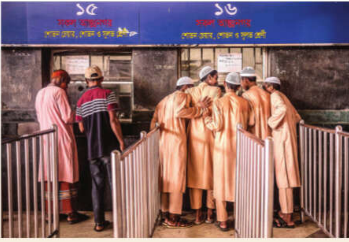
டாக்காவில் ரயில் போக்குவரத்து செவ்வாய்க்கிழமை மீண்டும் தொடங்கியதைக் குறித்து பயணச் சீட்டுகளை வாங்கிய பொதுமக்கள்.