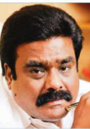
அவ்வப்போது போராட்டம் நடத்தி வந்தனர்.

முதலீட்டாளர்கள் போராட்டம்: இந்த நிதி நிறுவனத்தில் முதலீடு செய்த வாடிக்கையாளர்கள் களுக்கு கடந்த 6 மாதங்களுக்கு மேல் எந்தவித நிதியும் அளிக்காமல், பணம் இல்லை எனக் கூறி வந்தனர். மேலும், சிலருக்கு வழங்கப்படாத போராட்டம் நடத்தி வந்தனர்.