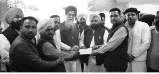
ਆਜ਼ਾਦ ਸੋਚ, ਐਕਸ਼ਨ ਕਮਿਟੀ, ਸ੍ਰੀ ਅਨੰਦਪੁਰ ਸਾਹਿਬ, 14 ਮਾਰਚ :

ਪੰਜਾਬ ਵਿਧਾਨ ਸਭਾ ਦੇ ਸਪੀਕਰ ਕੁਲਦੀਪ ਸਿੰਘ ਸੇਖਵਾ ਅਤੇ ਸਿੱਖਿਆ ਮੰਤਰੀ ਹਰਜੋਤ ਬੈਂਸ ਨੇ ਸੂਚਨਾ ਕੇਂਦਰ ਨੂੰ ਲੋਕ ਅਰਥੀ ਕਰਨ ਉਪਰੰਤ ਵੱਖ ਵੱਖ ਪਿੰਡਾਂ ਨੂੰ ਗ੍ਰਾਂਟਾਂ ਦੇ ਗੱਠੇ ਵੱਡੇ ਅਤੇ ਸ੍ਰੀ ਅਨੰਦਪੁਰ ਸਾਹਿਬ ਹਲਕੇ ਦੀ ਨੁਹਾਰ ਬਦਲਣ ਦਾ ਦਾਅਵਾ ਦੁਹਰਾਇਆ। ਇਸ ਮੌਕੇ ਦੋਵੇਂ ਆਗੂਆਂ ਨੇ 7.22 ਲੱਖ ਦੀ ਗ੍ਰਾਂਟ ਗੰਗੂਵਾਲ ਤੇ ਝਿਜੜੀ ਅੰਪਰ ਲਈ ਦਿੱਤੀ। ਉਨ੍ਹਾਂ ਨੇ ਭਲਾਣ 6.50 ਲੱਖ ਰੁਪਏ, ਭਨੁਪਲੀ 3.75 ਲੱਖ ਰੁਪਏ, ਸੁਰੇਵਾਲ ਅੰਪਰ 3 ਲੱਖ ਰੁਪਏ, ਨੰਗਲੀ 2 ਲੱਖ ਰੁਪਏ, ਰਾਏਪੁਰ ਅੰਪਰ 2 ਲੱਖ, ਬੀਕਾਪੁਰ ਅੰਪਰ 2 ਲੱਖ, ਮਾਣਕਪੁਰ 1.5 ਲੱਖ, ਜਿੰਦਵਾਲੀ/ਦਬੱਬੜਾ/ਭਾਲਵਾਲ/ਗੰਗੂਵਾਲ/ਬਾਸੋਵਾਲ/ਖੰਡਾ ਲੋਅਰ ਨੂੰ 1-1 ਲੱਖ ਰੁਪਏ, ਜਿੰਦਵਾਲੀ 1 ਲੱਖ ਰੁਪਏ ਦੇ ਚੈਕ ਵੰਡੇ ਗਏ। ਇਹ ਰਾਸ਼ੀ ਪਿੰਡਾਂ ਦੇ ਵਿਕਾਸ ਕਾਰਜਾਂ ਲਈ ਬੋਰਡ ਸਹਾਇਤਾ ਦੇ ਉਪਭੋਗੀ ਸਿੱਧ ਹੋਵੇਗੀ। ਹਲਕੇ ਦੀ ਬਦਲ ਰੀ ਨੁਹਾਰ ਬਾਰੇ